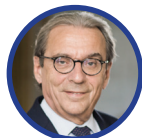
Roland Ries, Presidente de Cités Unies France Alcalde de Strasbourg

Les invito a participar en esta 11ª edición de los Encuentros de Acción Internacional de Autoridades Locales y Regionales: ¡esperamos verles allí !