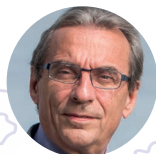
Roland Ries, Président de Cités Unies France

Depuis 2010, Cités Unies France propose un évènement annuel aussi fédérateur qu'incontournable dans le monde de la coopération décentralisée, décrit comme « le Davos de l'action internationale des collectivités territoriales » par la Présidence de la République lors de la venue du Président François Hollande en 2015.