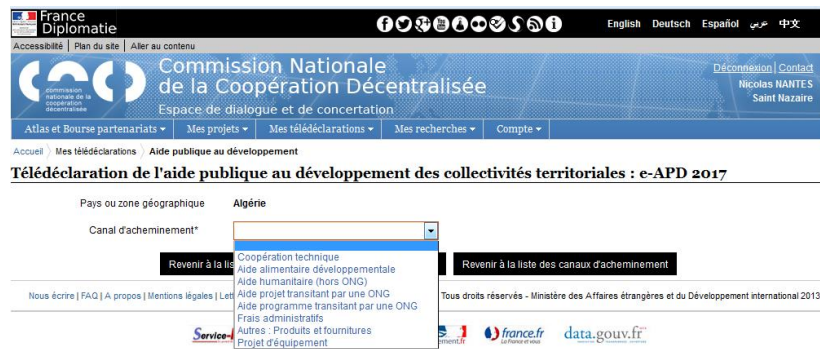
Fig. 3 : Sélectionner le canal d'acheminement par lequel transite votre APD vers ce pays (vous pouvez en sélectionner autant que nécessaire en cliquant sur le « + »).