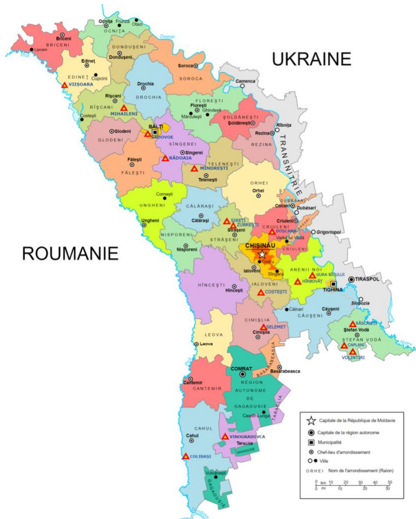
Carte de la Moldavie