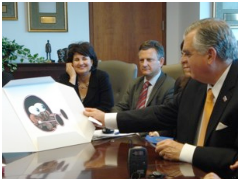
M. LaHood reçoit un souvenir de la ville de Strasbourg.

La rencontre au ministère a permis de faire émerger une convergence de vues sur l'importance capitale de la lutte contre le réchauffement climatique et du développement d'une économie verte. L'adoption du projet de loi « climat » par la deuxième chambre du congrès témoigne d'une volonté nouvelle à cet égard.