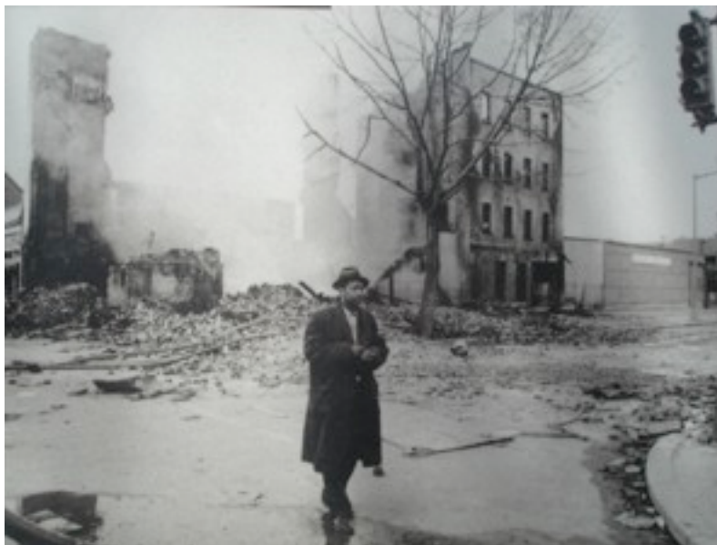
H Street en 1968...

Ensuite, la ville a décidé de construire son centre administratif à l'avenue Martin Luther King jr, à l'endroit même où tout avait commencé.