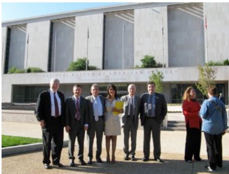
(Une partie de) la délégation devant le musée national de l'histoire des Etats-Unis