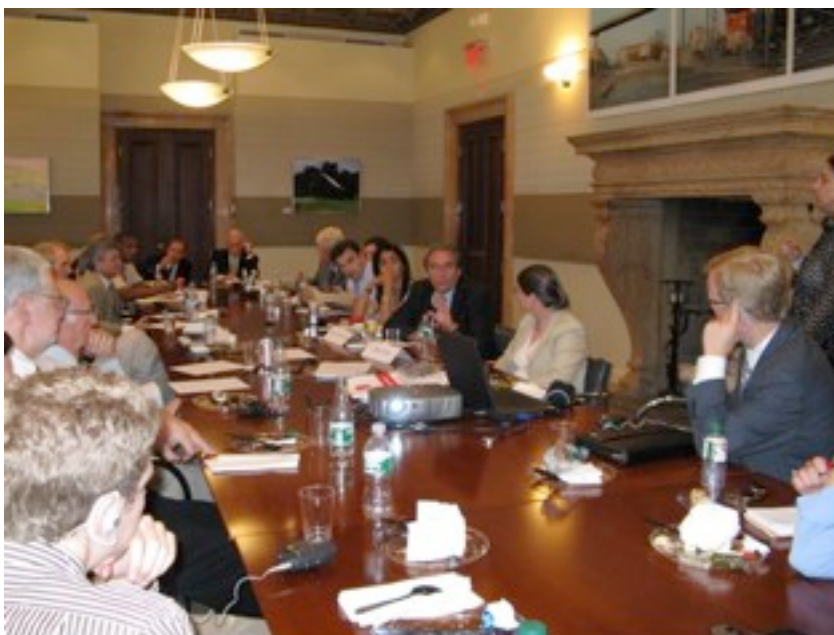
Buffet/conférence/débat, avec des élus et experts américains, invités par la fondation