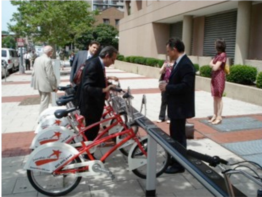
Les vélos « libres » flambant neufs à Washington

La veille, la délégation française avait visité à un quartier en rénovation. Il s'agissait du quartier fortement endommagé par les émeutes qui ont suivi l'assassinat de Dr. Martin Luther King jr. en 1968. Pendant trente ans, le quartier a sombré.