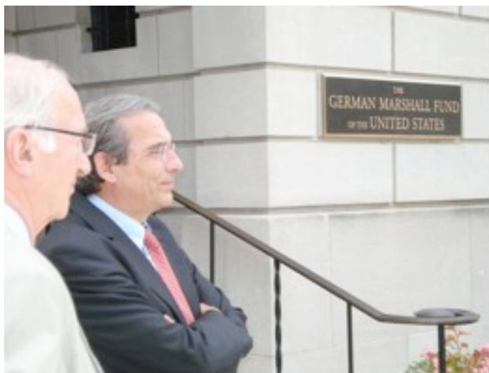
A l'entrée de la fondation