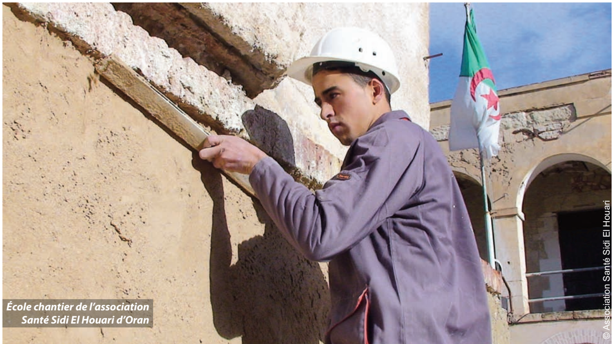
École chantier de l'association Santé Sidi El Houari d'Oran