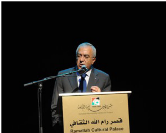
M. Salam Fayyad, Premier ministre de l'Autorité palestinienne, lors de la mission du Réseau européen des collectivités locales pour la paix au Proche-Orient, en octobre 2009

Cette réunion sera également l'occasion de préparer les prochaines Assises de la coopération décentralisée franco-palestinienne.